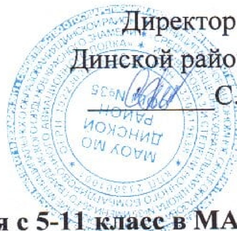
График родительского контроля с 5-11 класс в МАОУ МО Динской район СОШ №35