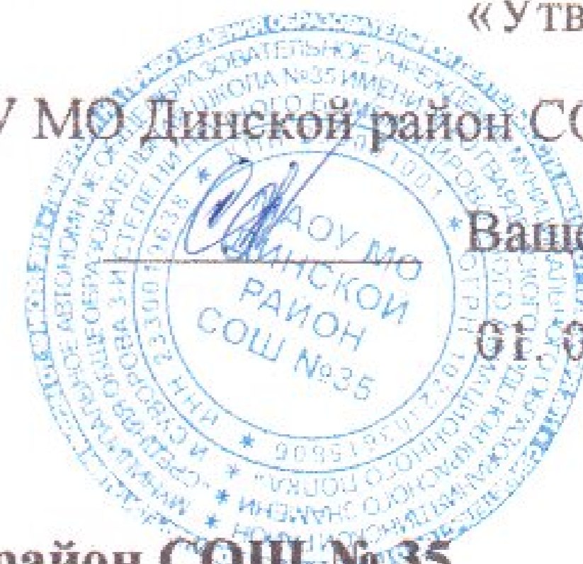
График дежурства родителей МАОУ МО Динской район СОШ № 35

в школьной столовой на сентябрь 2023 года. 2 смена.